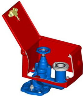
Modelo Europa Porto