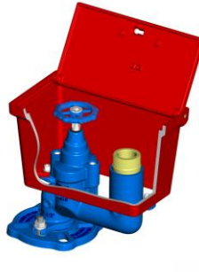
Modelo Europa Figueira da Foz