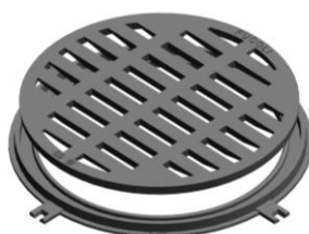
Redonda 50 D400