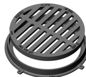
Redonda 60 D400

Sendo um dos principais objectivos da nossa empresa o desenvolvimento e aperfeiçoamento dos nossos produtos, reservamo-nos no direito de fornecer quaisquer outros que possam diferir ligeiramente dos descritos e ilustrados nesta publicação.