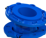
DN 40 a DN 600