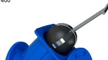
Pormenor da extração da bola através da chave para remoção de bola [ref.05.800]