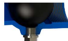
Pormenor do bujão (opção)